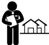
Économistes de la construction