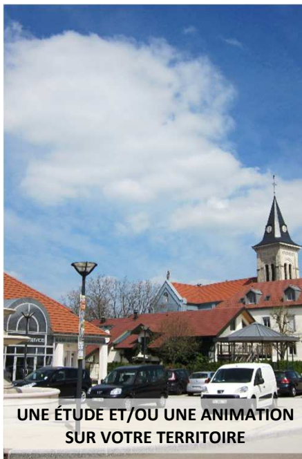
UNE ÉTUDE ET/OU UNE ANIMATION SUR VOTRE TERRITOIRE