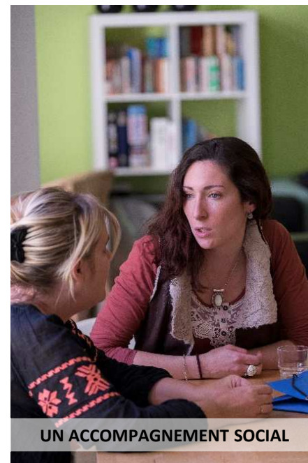
UN ACCOMPAGNEMENT SOCIAL