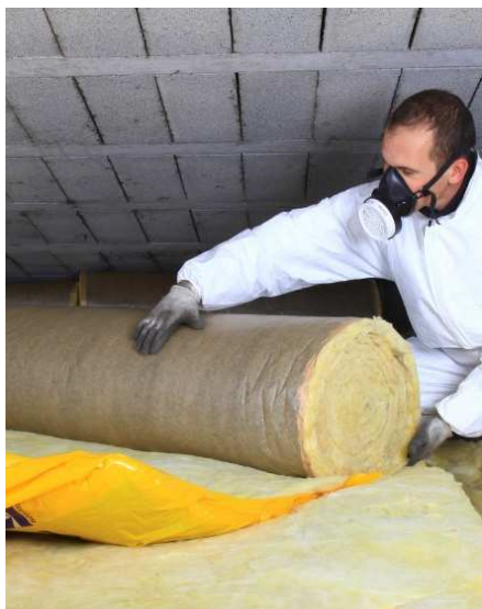
UN ACCOMPAGNEMENT TECHNIQUE ET ADMINISTRATIF POUR TOUS VOS TRAVAUX

VOUS ACCOMPAGNE DANS VOS BESOINS EN MATIÈRE DE RÉNOVATION DE L'HABITAT